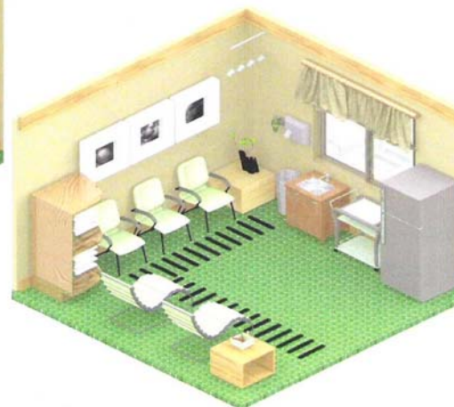
VISTA EN ISOMÉTRICO